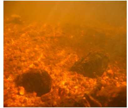
Moules perlières dans le Cousin (21)

Deux espèces (la Moule perlière et la Petite mulette) protégées par la loi française et inscrites à l'annexe II de la Directive Habitats Faune Flore se rencontrent en Morvan. Parmi les espèces de mollusques bivalves présentes sur le Morvan, la Moule perlière tient une place de choix. C'est une espèce d'un grand intérêt patrimonial, témoignant de la qualité du cours d'eau qui l'héberge. Le Morvan représente la seule localité de Bourgogne et de l'ensemble du bassin de la Seine où l'espèce est encore présente, mais malheureusement en quantité très faible. Un inventaire des cours d'eau à Moule perlière dans le Parc naturel régional du Morvan (COCHET, 1999) a permis la découverte de 8 secteurs où l'espèce est présente. La Moule perlière habite les cours d'eau à courant relativement rapide et nécessite une eau de bonne qualité, bien oxygénée et pauvre en calcium.