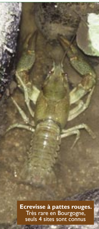
Ecrevisse à pattes rouges. Très rare en Bourgogne, seuls 4 sites sont connus

Six espèces d'écrevisses sont présentes en Bourgogne.