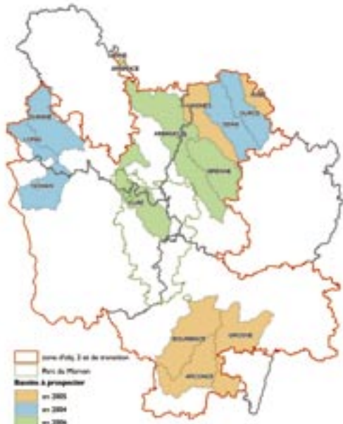
Localisation des bassins à prospecter dans le cadre du programme écrevisses

En 2003, avec l'embauche d'un deuxième salarié, l'Observatoire de la Faune Aquatique Patrimoniale de Bourgogne sert de relais au GEB.