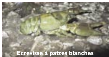
Ecrevisse à pattes blanches