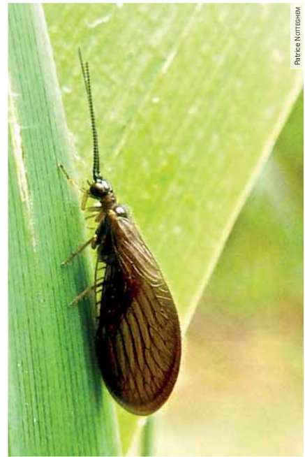
Photographie 5. Imago de Sisyre noire. Lac de la Sorme, Blanzay (71), 10 septembre 2012

Le Groupe Opie-benthos a lancé tout récemment un atlas des Mégaloptères et Névroptères à larves aquatiques de France - www.opie-benthos.fr