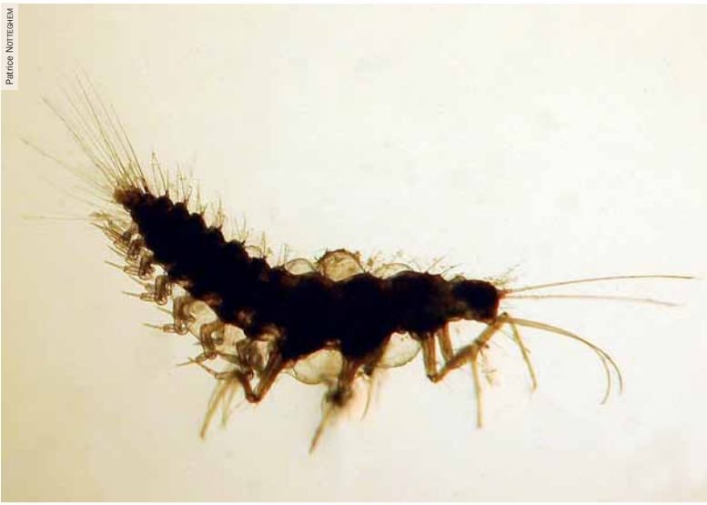
Photographie 6. Vue en contre-jour d'une larve de Sisyre noire (stade 3) rendant visibles les trachéobranchies ventrales ainsi que les antennes et les fines pièces buccales. Étang de la Velle, Saint-Sernin-du-Bois (71), 25 septembre 2010.

des larves aquatiques de Névroptères et particulièrement longs chez les Sisyridae . La larve respire grâce à 7 paires de trachéobranchies situées sur la partie ventrale de son abdomen (photographie 6). A la fin de son développement, après 3 stades, la larve quitte son hôte, nage jusqu'à la berge, acquiert la respiration aérienne (GAUMONT, 1966), grimpe dans la végétation et y construit un cocon, constitué d'un filet externe à grosses mailles et d'un filet interne en soie, dans lequel elle va se nymphoser. Après l'émergence, nocturne, une dernière mue libérera l'imago.