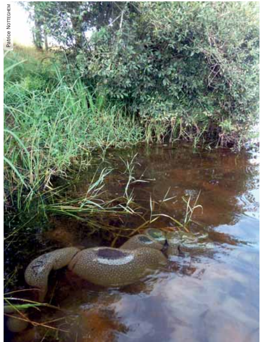
Photographie 4. Colonies de Pectinatelles à proximité d'un bouquet de saules dans lequel ont été trouvés des imagos de Sisyre noire. Lac de la Sorme, Blanzly (71), 23 août 2012.