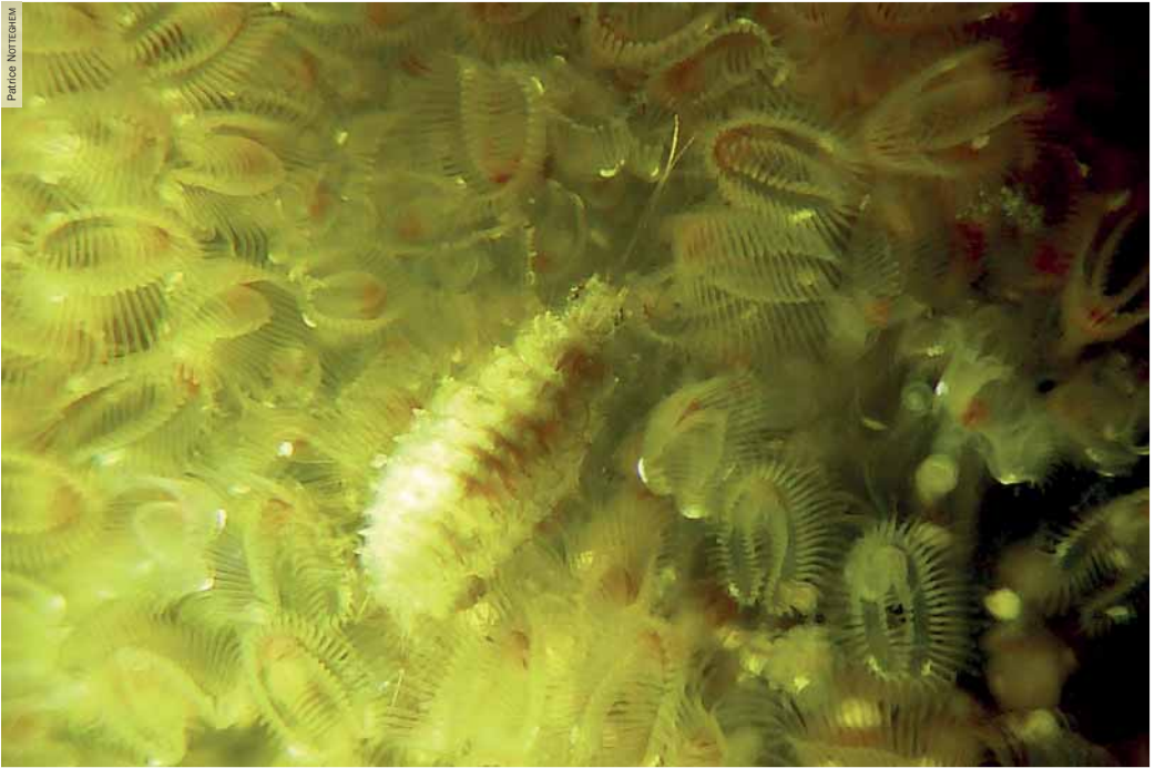
Photographie 1. Larve de Sisyre noire (stade 3) se déplaçant parmi les zoécies d'une colonie de Pectinatelle. Lac de la Sorme, Blanzly (71), 27 juin 2012.