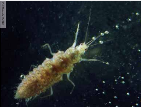
Photographie 2. Larve de Sisyre noire (stade 3), face dorsale. Étang du Baronnet, Martigny-le-Comte (71), 15 juillet 2012.