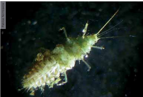
Photographie 3. Larve de Sisyre noire (stade 3), face ventrale Étang du Baronnet, Martigny-le-Comte (71), 15 juillet 2012.